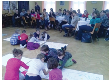
Otwarte zajęcia dla nauczycieli.