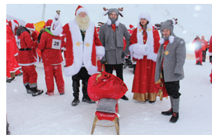
Zawody Mikołajów odbyły się w Szwajcarii.