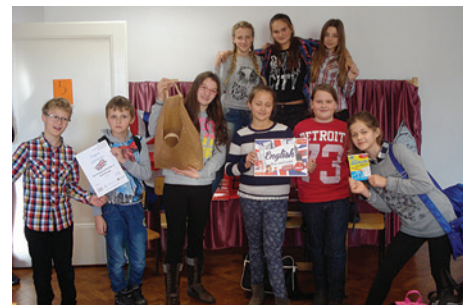
W Alternatywnej Szkole Podstawowej dużo się dzieje.

roku festiwal miał charakter warsztatów językowych. Uczniowie zostali podzieleni na grupy zadaniowe, co pozwoliło na zawarcie nowych znajomości i wymianę doświadczeń.