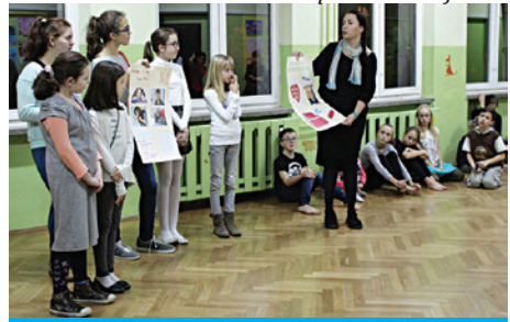
„Wieczór z Korczakiem” był bardzo udany.