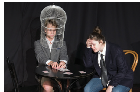
Młodzi aktorzy dali z siebie wszystko.