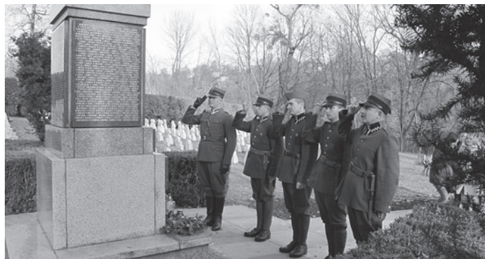
Na Cmentarzu Komunalnym w Cieszynie.