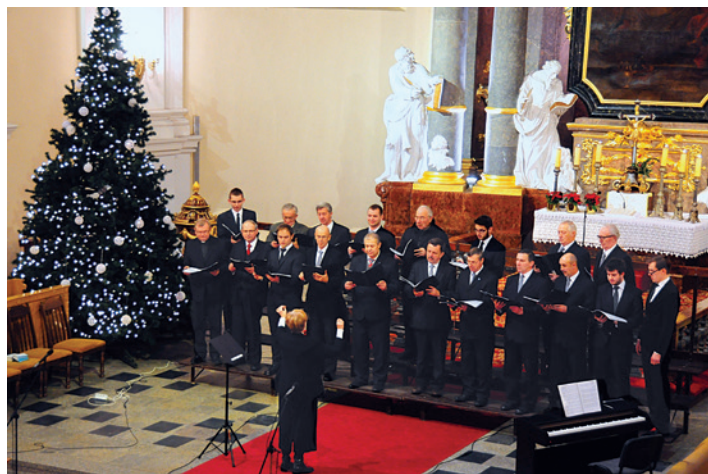
Idea założenia chóru zrodziła się w 2009 roku.

Połączone chóry męskie zaśpiewały m.in. na koncercie z okazji 100. rocznicy urodzin Jana Sztwiertni w Wiśle (9 października 2011 r.). 5 maja 2013 r. chór koncertował na zaproszenie bp. Władysława Wolnego w czeskiej Stonawie w kościele ewangelickim i rzymsko-