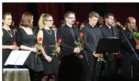
Na deskach ustrońskiej Prażakówki.

28 listopada w MDK Prażakówka w Ustroniu odbył się piękny koncert zorganizowany przez Liceum i Gimnazjum Towarzystwa Ewangelickiego w Cieszynie przy udziale I Liceum im. M.Kopernika z Katowic.