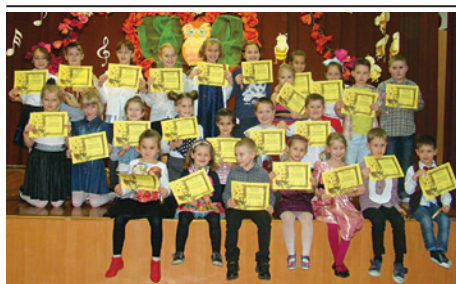
Uczniowie „jedynki” potrafią się bawić.

13 listopada w Szkole Podstawowej nr 1 w Cieszynie odbył się szkolny finał konkursu aktorsko-recytatorskiego Bawimy się słowami . Wystartowało w nim 27 uczestników z klas I-III, prezentując różne wiersze i prozę w obecności zaproszonych rodziców.