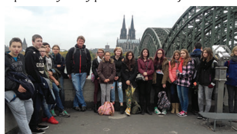
Uczniowie zwiedzili wiele ciekawych miejsc.