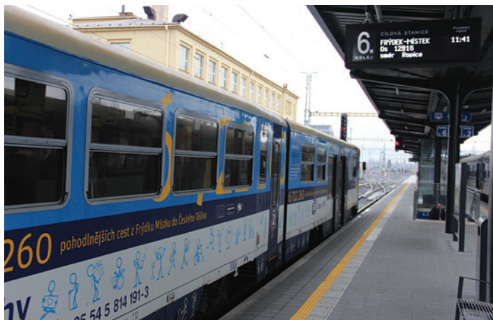
Na razie pociągi do Frydka-Mistka odjeżdżają z Czeskiego Cieszyna. Od 13 grudnia to się zmieni.