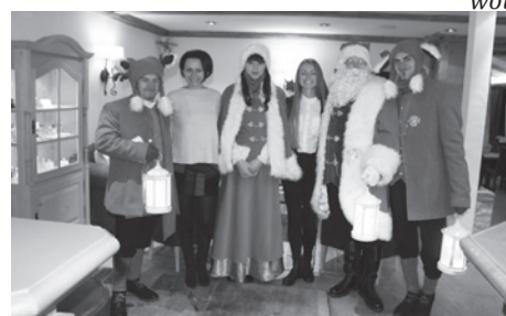
Nasza ekipa prezentowała się bardzo dobrze.